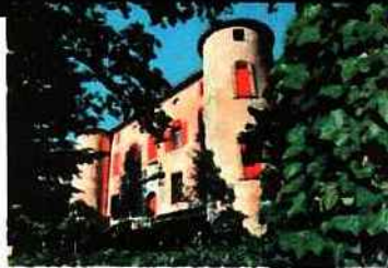
Château de Vauvenargues

Le soleil, la mer, la belle vie... c'est le Midi. Mais cet été, la Provence et la Côte d'Azur ajoutent une dimension supplémentaire au séjour, car l'année 2009 y sera entièrement placée sous le signe de Pablo Picasso. Un choix logique dans la mesure où le génial peintre espagnol y a passé une grande partie de sa vie.