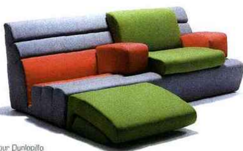
Compo'Sit pour Dunlopillo

Quand Jim monte à Paris, une "colonne d'hospitalité" qui se déplie quand on a un invité pour devenir un lit équipé d'une petite lampe et d'un réveil. Déjà, on remarque dans ce projet un rejet de la recherche formelle pure, un souci du bien vivre ensemble et une volonté de réponse aux nouvelles habitudes de vie de notre société. Une empreinte qui rend cet objet encore aujourd'hui emblématique.